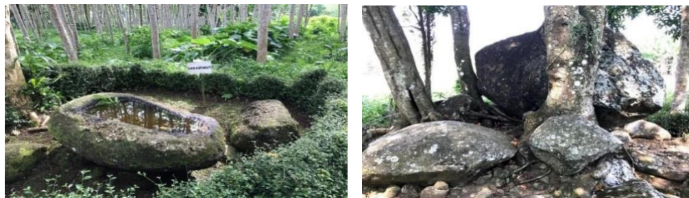
Gambar 1. Situs Megalitikum (Sarkofagus & Dolmen) di Desa Seputih Kec. Mayang Kab. Jember

yang masih rendah menjadi salah satu alasan dilakukannya penelitian ini. Menjadi sangat penting untuk mengetahui penyebab dari fenomena sosial tersebut serta dapat mengukur dampaknya bagi keberadaan situs bersejarah dan kelestarian situs sebagai warisan budaya bangsa Indonesia.