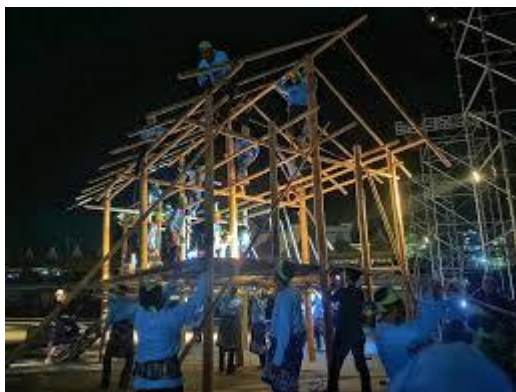
Gambar 2. Tradisi Mapatettong Bola

Tradisi Mapatettong Bola dalam masyarakat Bugis melibatkan aspek-aspek sosio-kultural yang kuat, memperlihatkan bagaimana budaya berfungsi sebagai media pembelajaran lintas generasi melalui etnopedagogi. Budaya tidak hanya menjadi “jalan masuk” dalam memahami nilai-nilai kerja sama dan solidaritas, tetapi juga “jalan keluar” yang memberikan solusi untuk menjaga keharmonisan sosial dalam masyarakat. Sebagaimana yang diungkapkan dalam wawancara, pelaksanaan Mapatettong Bola menekankan pentingnya gotong royong , di mana setiap individu berperan sesuai kapasitasnya: ibu-ibu mempersiapkan sesajian yang memiliki nilai simbolis, seperti cindolo dan beppa 7 rupa , sementara bapak-bapak bekerja sama dalam mendirikan rumah.