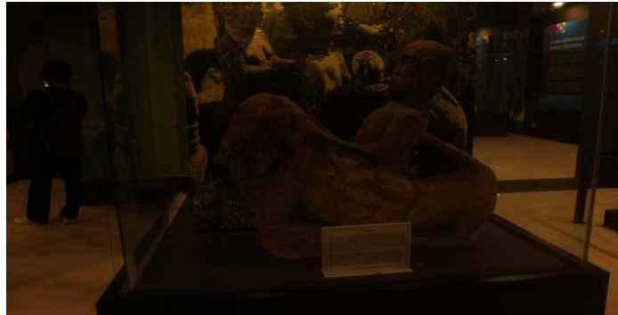
Gambar 6. Mejan

Patung batu megalitik nama Batak: Mejan, Adu Zato, Adu Zatus, Adu Niu, Adu Famo, Adu Ono Matua, Debata Idup, Angulubalang