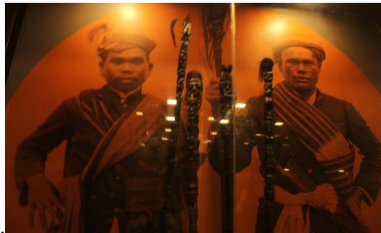
Gambar 3. Tunggal Panaluan

Replika Tongkat, Wadah, Peti Jenazah, dan Boneka nama Batak Tunggal Panaluan, Sahan, Naga Morsarang, Sigale-gale. Dalam masyarakat Batak tradisional, terdapat berbagai benda yang memiliki fungsi magis dan berkaitan dengan praktik ritual yang dipimpin oleh seorang datu atau pemuka spiritual. Artefak-arterfak tersebut menunjukkan bahwa seni ukir dan kerajinan tradisional Batak sering kali memiliki fungsi yang berkaitan dengan sistem kepercayaan dan praktik spiritual. Salah satu artefak yang memiliki nilai penting dalam tradisi ritual Batak adalah Tunggal Panaluan, yaitu tongkat ritual yang digunakan oleh datu dalam berbagai upacara adat. Tongkat ini biasanya terbuat dari kayu dan dihiasi dengan ukiran figur manusia yang tersusun secara vertikal sepanjang batang tongkat. Ukiran tersebut sering dihubungkan dengan kisah mitologi atau legenda tradisi Batak