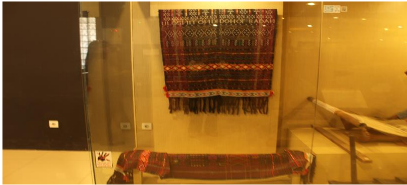
Gambar 2. Sadum atau Abit Godang

Gambar 2 menjelaskan bahwa dalam hasil pengamatan terhadap artefak tekstil Batak, ditemukan keberadaan Ulos Sadum yang juga dikenal dengan sebutan Ulos Abit Godang. Ulos ini termasuk dalam kelompok kain adat yang memiliki fungsi penting dalam praktik budaya masyarakat Batak, khususnya dalam berbagai upacara secara etimologis merujuk pada “kain besar” atau “kain agung”, yang menunjukkan kedudukannya sebagai kain yang digunakan dalam konteks seremonial. Secara visual, Ulos Sadum atau Abit Godang memperlihatkan komposisi ornamen yang didominasi oleh pola geometris berupa susunan garis-garis horizontal yang tersusun secara teratur. Struktur motif tersebut menampilkan ritme visual yang stabil serta memperlihatkan prinsip pengulangan pola yang menjadi karakter umum dalam seni hias tekstil Batak.