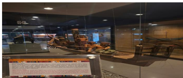
Gambar 8. Miniatur Solu

Peralatan kehidupan sehari-hari tradisional masyarakat Batak nama Batak: Kitang, Gumar, Hitang, Kepuk, Rumbi, Rakke, Solu.