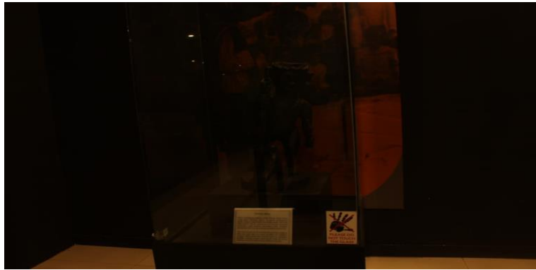
Gambar 7. Debata Idup

Gambar ini memperlihatkan artefak Debata Idup yang dipajang di dalam kotak kaca sebagai bagian dari koleksi museum. Artefak ini berbentuk patung manusia yang diukir dari bahan kayu dengan bentuk tubuh tegak dan proporsi yang sederhana namun memiliki karakter ekspresif. Pada bagian tubuh dan wajah terlihat bentuk pahatan yang menonjolkan ciri khas seni ukir tradisional Batak, seperti garis tegas dan bentuk yang simbolis. Debata Idup dalam tradisi masyarakat Batak Toba berkaitan dengan konsep kekuatan spiritual atau perwujudan roh yang dipercaya memiliki peran dalam kehidupan religius masyarakat. Penempatan artefak ini di dalam vitrin museum menunjukkan upaya pelestarian terhadap benda budaya yang memiliki nilai historis, estetis, dan spiritual dalam tradisi kesenian Batak Toba. Artefak tersebut juga memperlihatkan bagaimana seni rupa tradisional tidak hanya berfungsi sebagai karya visual, tetapi juga sebagai media yang merepresentasikan sistem kepercayaan dan pandangan hidup masyarakat pada masa lalu.