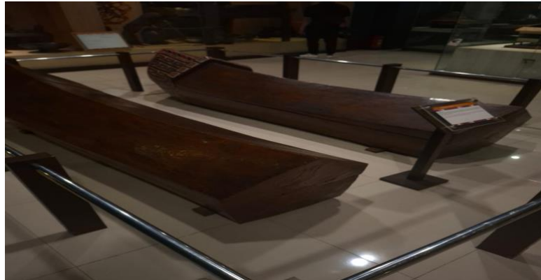
Gambar 4. Abal-abal

untuk menyimpan ramuan atau bahan ritual oleh datu. Bentuk wadah ini sering dihiasi dengan ukiran dekoratif yang memiliki karakter visual yang khas.