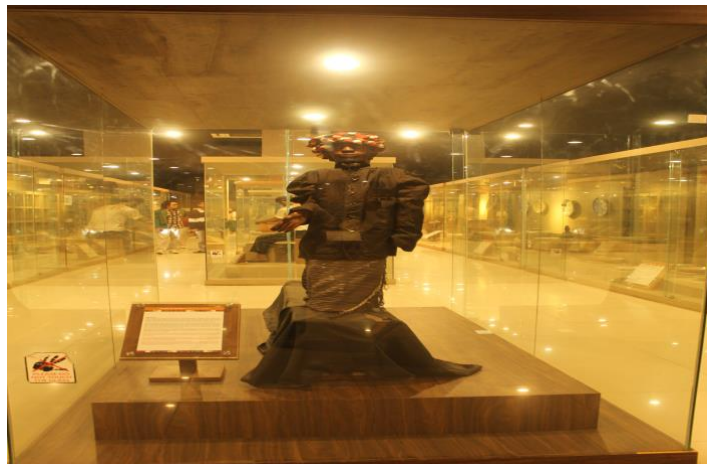
Gambar 5. Sigale-gale

Selain itu, terdapat pula benda yang dikenal sebagai Abalabal, yaitu peti jenazah yang digunakan dalam tradisi pemakaman tertentu. Dalam konteks budaya Nias Selatan, peti jenazah sering dihiasi dengan ukiran yang memiliki nilai estetika sekaligus makna simbolik yang berkaitan dengan penghormatan terhadap orang yang telah meninggal.