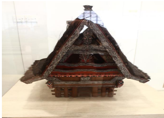
Gambar 1. Miniatur Rumah Bolon

Gambar 1 menunjukkan bahwa salah satu artefak yang merepresentasikan tradisi arsitektur Batak adalah miniatur Rumah Bolon, yaitu rumah adat masyarakat Batak Toba yang memiliki bentuk arsitektur yang unik dan khas. Rumah Bolon merupakan rumah tradisional yang berfungsi sebagai pusat kehidupan keluarga dan kegiatan sosial dalam masyarakat Batak. Secara historis, rumah adat Batak Toba berkembang sebagai bentuk arsitektur yang disesuaikan dengan lingkungan kehidupan masyarakat Batak. Struktur rumah panggung dengan tiang-tiang kayu menopang bagian badan rumah berfungsi untuk melindungi bangunan dari kelembapan tanah dan gangguan hewan. Dari sudut pandang seni rupa, miniatur rumah adat Batak Toba memperlihatkan karakter visual yang mencerminkan estetika arsitektur tradisional Batak. Salah satu ciri utama adalah bentuk atap yang tinggi dan melengkung, menciptakan siluet yang khas dan mudah dikenali. Pada fasad dan dinding rumah terdapat ornamen ukiran yang dikenal sebagai Gorga. Ornamen ini membentuk pola garis melengkung yang kompleks dan dinamis. Motif-motif tersebut disusun secara dekoratif pada bagian dinding, balok, dan bidang tertentu rumah. Warna yang