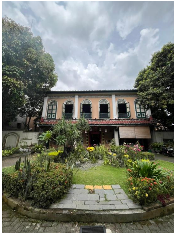
Gambar 2. Fasad Eksterior Tjong A Fie Mansion

Hasil observasi menunjukkan bahwa Tjong A Fie Mansion memiliki bangunan dua lantai dengan komposisi fasad yang simetris. Pada lantai dua terlihat deretan jendela dengan bentuk lengkungan pada bagian atasnya. Karakteristik ini merupakan salah satu ciri yang umum ditemukan pada bangunan bergaya arsitektur kolonial yang berkembang di Indonesia pada masa Hindia Belanda.