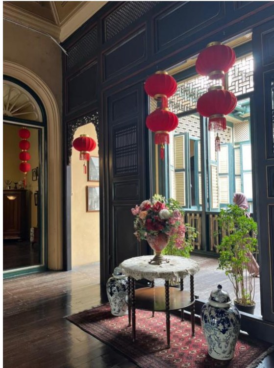
Gambar 4. Struktur Rumah Terbuka di Tjong A Fie Mansion