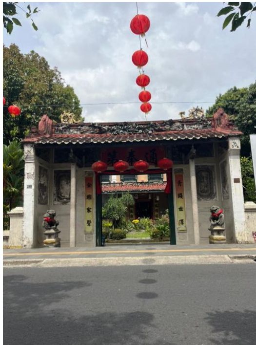
Gambar 1. Gerbang Utama Tjong A Fie Mansion

Gerbang utama Tjong A Fie Mansion menjadi elemen pertama yang memperlihatkan identitas budaya pemilik bangunan. Pada bagian atas gerbang terdapat ornamen dekoratif serta lampion merah yang merupakan simbol penting dalam budaya Tionghoa. Lampion merah dalam tradisi Tionghoa memiliki makna simbolik yang berkaitan dengan keberuntungan, kemakmuran, serta kebahagiaan dalam kehidupan keluarga.