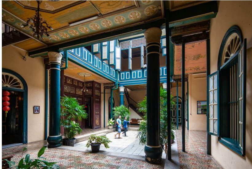
Gambar 2. Courtyard pada Tjong A Fie Mansion

Salah satu karakteristik penting yang ditemukan dalam tata ruang Tjong A Fie Mansion adalah keberadaan courtyard atau halaman terbuka yang terletak di bagian tengah bangunan. Dalam tradisi arsitektur Tionghoa, courtyard merupakan elemen ruang yang memiliki fungsi penting dalam struktur rumah tradisional.