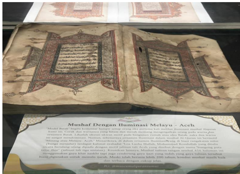
Gambar 1. Koleksi Mushaf dengan Iluminasi Melayu - Aceh

Bentuk visual mushaf Al-Qur'an yang diamati di Museum Al-Qur'an Sumatera Utara menunjukkan karakteristik manuskrip kuno yang bernilai tinggi dengan kondisi fisik yang masih cukup terawat meskipun telah berusia lebih dari 200 tahun. Mushaf ini memiliki ketebalan sekitar 456 halaman dengan penjiilidan tradisional yang khas, serta menggunakan media kertas yang secara visual memiliki tekstur dan warna coklat alami akibat proses oksidasi alami. Analisis terhadap unsur estetika seni rupa pada mushaf tersebut memperlihatkan dominasi penggunaan gaya khat Naskhi yang dikombinasikan dengan sentuhan gaya Ijazat pada penulisan ayat-ayatnya, memberikan kesan luwes namun tetap memiliki keterbacaan yang jelas. Unsur iluminasi menjadi daya tarik utama dengan penerapan motif "Minang atau Melayu-