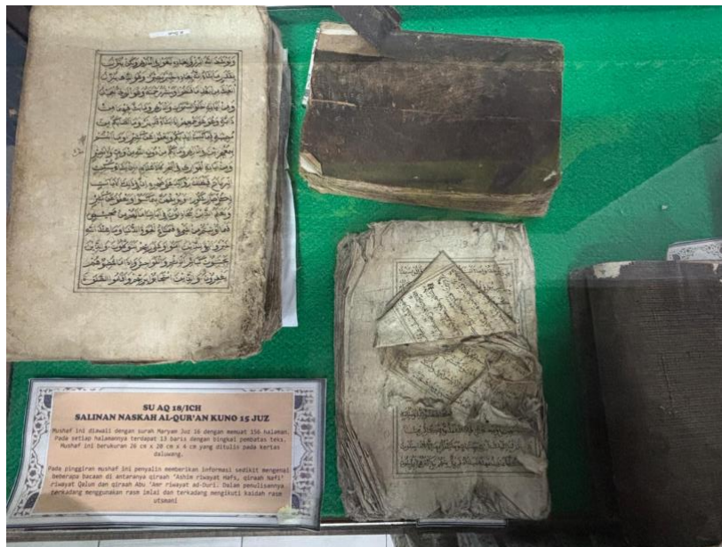
Gambar 3. Koleksi Mushaf SU AQ 18/ICH, Salinan Naskah Al-Qur'an Kuno 15 Juz

Bentuk visual mushaf Al-Qur'an yang diamati pada koleksi ini menunjukkan karakteristik manuskrip kuno yang sangat autentik dan bersifat peninggalan sejarah lokal. Mushaf ini ditulis di atas kertas daluang, yakni kertas tradisional yang terbuat dari olahan kulit kayu. Secara visual, kondisi fisik mushaf menunjukkan proses penuaan alami yang signifikan dengan pinggiran kertas yang mulai rapuh dan tidak rata, namun teksnya tetap terjaga dengan baik dalam 156 halaman. Struktur visualnya sangat khas, di mana setiap halaman dibatasi oleh bingkai pembatas teks sederhana (garis hitam ganda) yang membungkus 13 baris tulisan di setiap halamannya. Tampilan ini memberikan kesan kesederhanaan namun sarat akan nilai historis manuskrip nusantara.