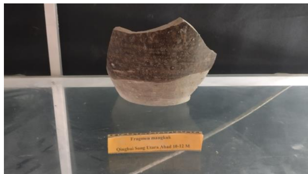
Gambar 4. Fragmen Mangkuk Qingbai Song Utara Abad 10-12 M