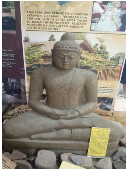
Gambar 2. Arca Dhiyani Buddha Amitaba

Gambar Arca tersebut merupakan artefak berbahan batu granit putih yang ditemukan pada tahun 1973 oleh penduduk sekitar Paya Pasir saat menggali lubang sampah, dan masih berada di wilayah Situs Kota Cina. Arca ini menggambarkan sosok Buddha dalam posisi duduk di atas lapik dengan kaki bersila, kaki kanan di atas kaki kiri. Sikap tangan yang ditampilkan adalah Dhyanamudra yaitu posisi bersemedi, dengan bentuk lidah api yang muncul dari Usnina atau tonjolan di puncak kepala. Bagian kaki digambarkan berlipat-lipat sehingga terkesan tebal dan kokoh. Gaya seni rupa arca ini serupa dengan arca-arca khas India Selatan dengan pengaruh Sri Lanka, diperkirakan berasal dari abad XII hingga XIV Masehi. Arca sejenis pernah ditemukan pula di Kedah, Malaysia dan Tamil Nadu, India.