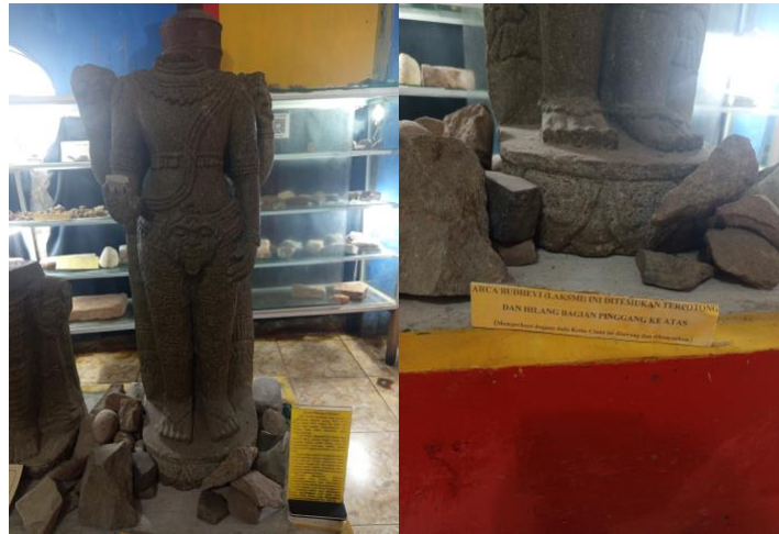
Gambar 1. Arca Wisnu

Gambar tersebut menunjukkan bahwa salah satu artefak paling signifikan yang tersimpan di Museum Kota Cina adalah Arca Wisnu. Arca berbahan batu granit ini ditemukan oleh warga pada tahun 1979, sekitar 80 meter arah timur dari lokasi ditemukannya Arca Buddha. Pada saat ditemukan, kondisinya sudah tidak utuh dengan bagian kepala dan sebagian tangan yang telah hilang. Arca ini digambarkan dalam posisi berdiri tegak dengan empat tangan, tangan kanan depan dalam posisi abhaya yaitu telapak terbuka dengan jari-jari menghadap ke atas yang bermakna menolak bahaya, sementara tangan kiri depan lepas ke bawah menyentuh paha kiri. Tangan-tangan belakang masih terlihat memegang cakera dan cangkang kerang. Ciri-ciri ikonografis tersebut menyerupai Arca Wisnu Adhama Bhogasthanakamurti dan Tiruvottiyur dan Arca Wisnu Bhogasthanakamurti dari Museum Madras, yang secara gaya termasuk dalam langgam seni khas India Selatan atau cola style , diperkirakan berasal dari rentang abad VII hingga XIV Masehi.