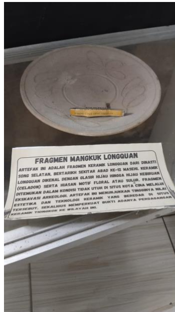
Gambar 5. Fragmen Mangkuk Qingbai Song Selatan Abad 12 M

Gambar tersebut menunjukkan bahwa Fragmen Mangkuk Qingbai yang ditemukan di Situs Kota Cina berasal dari dua periode berbeda. Fragmen pertama berasal dari Dinasti Song Utara pada abad X hingga XII Masehi, dengan ciri glasir transparan kebiruan hingga abu-abu pucat dan badan keramik berwarna putih keabu-abuan, terbuat dari tanah liat stoneware dengan kualitas pembakaran yang baik.