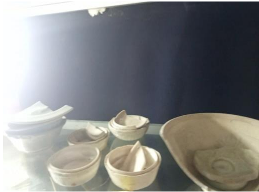
Gambar 3. Keramik Peninggalan Dinasti Yuan

Gambar tersebut memperlihatkan bahwa di Situs Kota Cina ditemukan beberapa fragmen keramik yang berasal dari masa Dinasti Yuan, yaitu dinasti yang didirikan oleh Kubilai Khan pada tahun 1271 hingga 1368 Masehi. Fragmen-fragmen tersebut terdiri dari tutup cepuk Dehua Qudougong yang dihiasi motif sulur-suluran dan berfungsi sebagai wadah kosmetik, fragmen mangkuk Celadon Longquan berglasir hijau dengan garis pembuluh putih, serta tabung air raksa atau Mercury Jar berwarna kelabu dengan permukaan yang cenderung kasar dan alur horizontal di bagian dalam. Keragaman jenis keramik yang ditemukan menunjukkan intensitas hubungan dagang antara Kota Cina dengan berbagai pusat produksi keramik di Tiongkok pada masa tersebut.