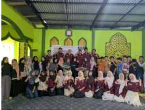
Gambar 4. Photo bersama kegiatan PKM sosialisasi pengenalan kue rasidah