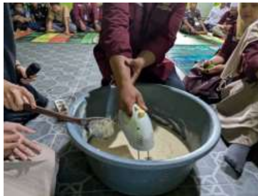
Gambar 2. Proses pembuatan kue rasidah

Salah satu temuan penting dalam kegiatan ini adalah meningkatnya pemahaman peserta mengenai nilai budaya yang terkandung dalam kue rasidah. Sebelum kegiatan sosialisasi dilakukan, sebagian peserta hanya mengenal kue rasidah sebagai makanan tradisional tanpa mengetahui sejarah dan makna budaya yang terkandung di dalamnya.