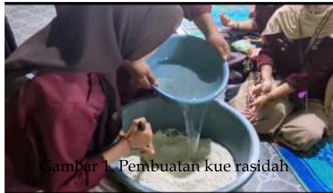
Gambar 1. Pembuatan kue rasidah

potensi pengembangan kue rasidah sebagai produk ekonomi kreatif yang dapat dikembangkan di masyarakat.