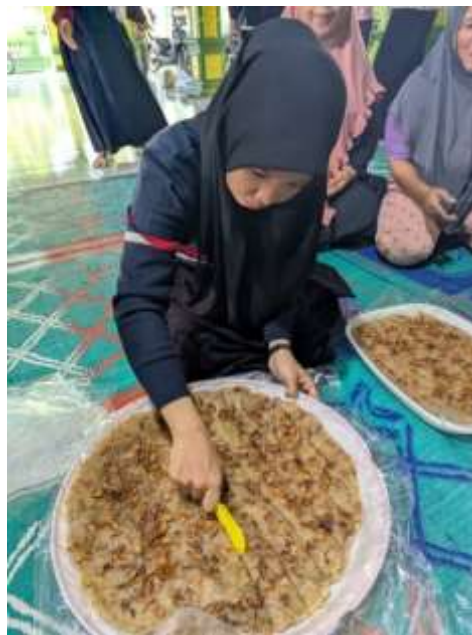
Gambar 3. Kue rasidah

Selain memiliki nilai budaya, kue rasidah juga memiliki potensi besar untuk dikembangkan sebagai produk ekonomi kreatif berbasis kearifan lokal. Dalam kegiatan sosialisasi ini, mahasiswa KKN memberikan pemahaman kepada peserta mengenai peluang usaha yang dapat dikembangkan dari kuliner tradisional.