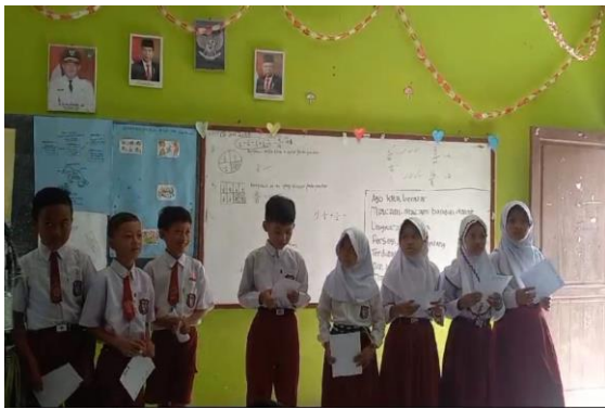
Gambar 2. Memainkan Peran

Langkah keempat , kami memanggil siswa yang tidak berperan sebagai komentator untuk melihat bagaimana pertunjukkan berjalan. Langkah kelima , siswa melakukan pertunjukkan sesuai dengan peran mereka masing-masing dan tetap mengikuti skenario yang telah mereka buat sebelumnya.