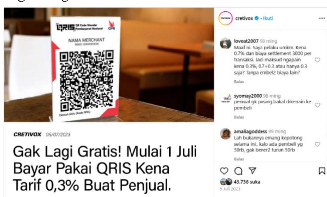
Gambar 4. Upaya Menghindari Stigma atau Diskriminasi

Penggunaan akun anonim di media sosial sering kali menjadi sarana bagi individu untuk menghindari stigma sosial atau diskriminasi. Dalam dunia yang semakin terbuka, banyak orang yang menghadapi ketidakadilan atau prasangka berdasarkan identitas pribadi mereka, seperti ras, agama, orientasi seksual, atau bahkan pandangan politik. Suler (2020) dalam penelitiannya mengenai "online disinhibition effect" mengemukakan bahwa anonimitas memberikan perlindungan bagi individu yang merasa tertekan dalam mengekspresikan diri mereka. Dalam konteks ini, anonimitas memberi ruang bagi individu untuk berbicara lebih bebas mengenai isu sensitif tanpa merasa takut akan penilaian sosial atau penghukuman, yang sering kali muncul ketika identitas mereka diketahui.