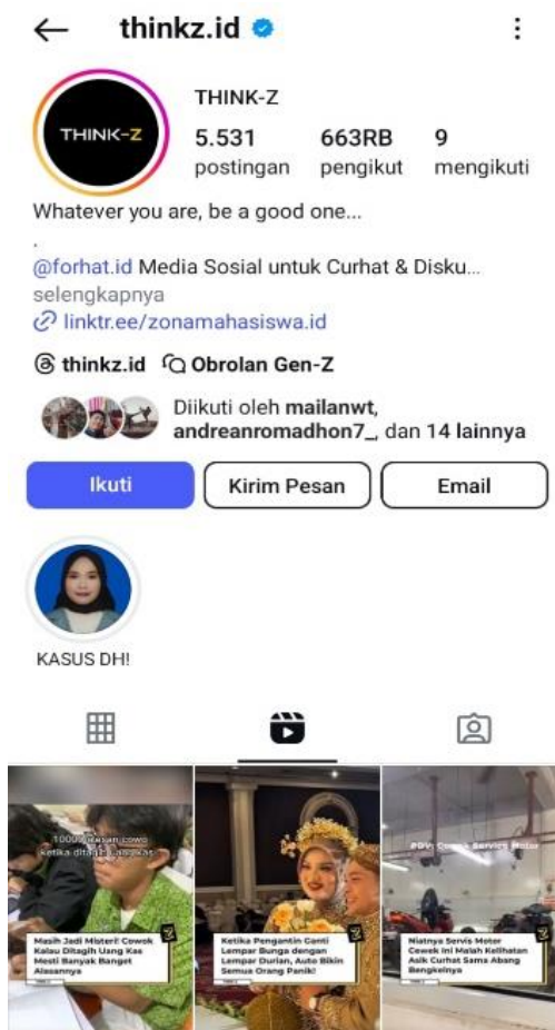
Gambar 1. Sikap Kebebasan Berekspressi di Instagram

topik-topik kontroversial, karena mereka tidak terikat oleh norma sosial atau pengawasan langsung, salah satu contoh akun anonim yang bebas berekspresi namun digunakan untuk hal positif pada media sosial Instagram dengan nama akun @thinkz.id, akun ini berisikan konten hiburan dan edukatif sehingga memberikan dampak yang positif juga baik penontonnya.