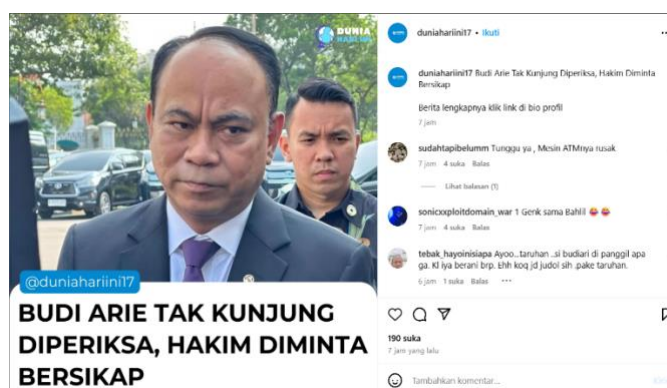
Gambar 3. Akses Informasi Sensitif

Selain itu, akun anonim juga memungkinkan pengguna untuk mengakses dan membagikan informasi yang sensitif terkait dengan isu sosial, politik, atau bahkan pribadi tanpa terikat oleh identitas mereka. Dilihat dari akun @duniahariini17 yang dimana akun tersebut adalah akun politik yang mengabarkan terkait dengan isu-isu yang sedang hangat terkait politik di Indonesia. Tanpa diketahui siapa pemilik akun sehingga akun tersebut dapat dengan mudah menyampaikan informasi seputar politik yang mungkin masih menjadi isu nasional. Dilihat dari komen yang ada, banyak pengguna yang menggunakan akun anonim untuk berkomentar. Binns (2016) menyatakan bahwa kebebasan untuk menjelajah dan mengakses informasi tanpa harus mengungkapkan identitas asli memberikan individu kebebasan untuk mengeksplorasi topik-topik yang mungkin tidak dapat dibahas secara terbuka. Dalam konteks ini, akun anonim menjadi alat penting bagi mereka yang membutuhkan privasi untuk mengakses informasi yang berkaitan dengan kesehatan, identitas seksual, atau opini politik yang tidak sesuai dengan norma sosial dominan di lingkungan mereka.