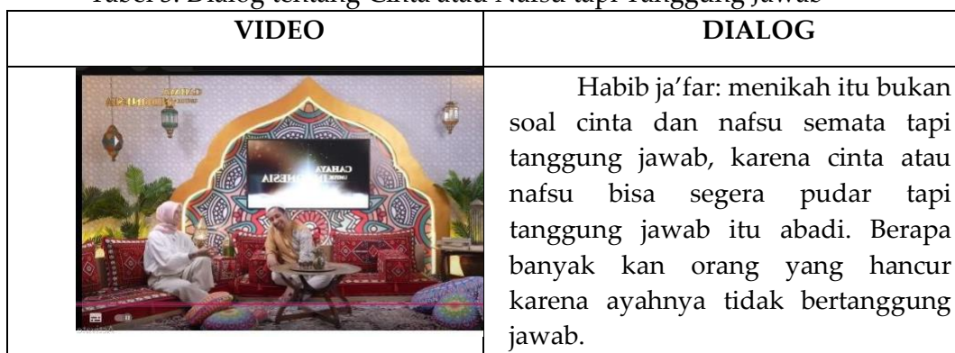
Tabel 3. Dialog tentang Cinta atau Nafsu tapi Tanggung Jawab

Pernikahan bukan hanya tentang cinta atau nafsu tapi tanggung jawab.