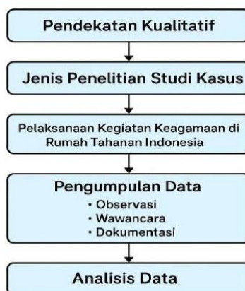
Gambar 1. Skema (Alur) Metode Penelitian

Analisis data dilakukan dengan menggunakan model interaktif Miles dan Huberman yang mencakup tiga tahapan utama, yaitu reduksi data, penyajian data, dan penarikan kesimpulan (Miles, Huberman, & Saldaña, 2014). Reduksi data dilakukan dengan cara merangkum, memilih data yang relevan, dan memfokuskan informasi yang sesuai dengan tujuan penelitian. Penyajian data dilakukan dengan mengorganisasi data dalam bentuk narasi deskriptif atau tabel untuk memudahkan pemahaman. Penarikan kesimpulan dilakukan dengan menafsirkan makna data yang telah dianalisis untuk menjawab pertanyaan penelitian secara komprehensif.