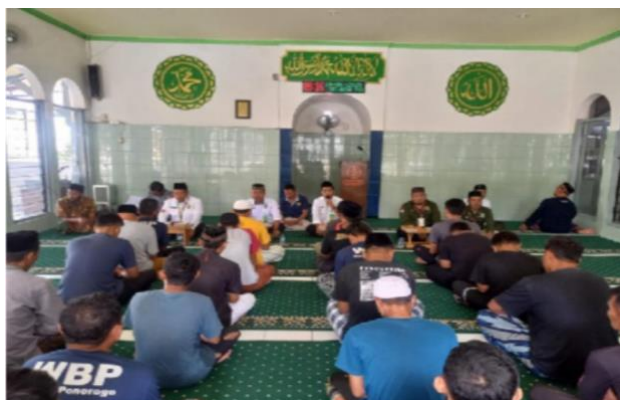
Gambar 3. Pembelajaran Al Qur'an

Pembina dari Kementerian Agama menyatakan bahwa keberhasilan metode sorogan bukan hanya terletak pada perbaikan bacaan, tetapi juga pada proses membangun hubungan personal yang positif antara pembina dan peserta.