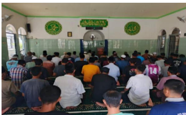
Gambar 2. Solat Berjamaah

Pembinaan di Rumah Tahanan menjadi indikator adanya pergeseran pola pikir warga binaan dari orientasi duniawi menuju kesadaran akhirat, yang dalam literatur rehabilitasi dianggap sebagai titik awal perubahan perilaku.